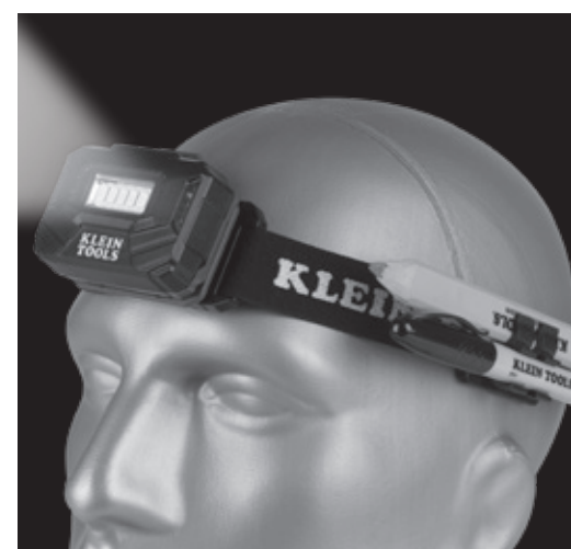
FIG. A FRONT / FRENTE / AVANT

Rechargeable Light Array Headlamp – Instructions Luz frontal con matriz de luz recargable – Instrucciones Lampe frontale rechargeable à large spectre – Instructions