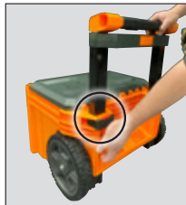
STEP 2 PASO 2 ÉTAPE 2