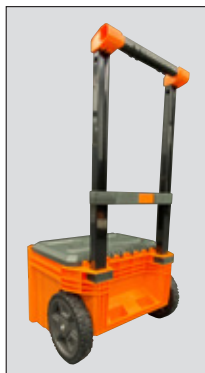
STEP 3 PASO 3 ÉTAPE 3