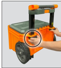
STEP 2 PASO 2 ÉTAPE 2