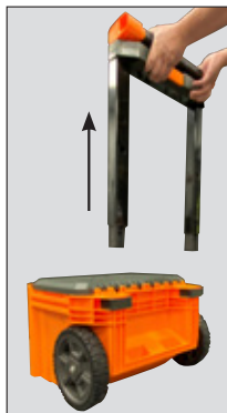
STEP 3 PASO 3 ÉTAPE 3