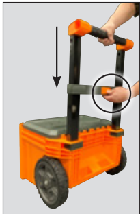
STEP 1 PASO 1 ÉTAPE 1

Instructions d'utilisation de la poignée : boîte à outils avec roulettes MODbox™ 54801MB